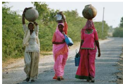
Frauen in Rajasthan