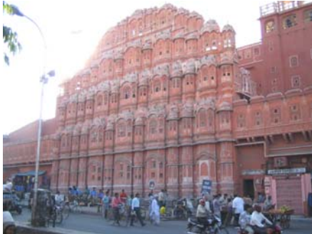
Der Palast der Winde in Jaipur/Rajasthan

Mit über einer Milliarde Einwohnern, 625 Sprachen und rund einem Dutzend Religionen ist Indien eines der faszinierenden Länder der Erde. Mittlerweile gehört Indien zu den aufstrebenden Industrienationen. Dieser Wandel zieht natürlich gesellschaftliche und kulturelle Veränderungen mit sich, die sich nicht nur im Alltagsleben bemerkbar machen, sondern auch die Kulturszene beeinflussen.