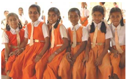
Indien ist ein junges Land