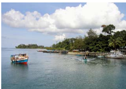
Kleiner Fischereihafen auf Great Andaman