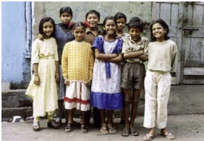
Die Kinder aus dem Rotlichtviertel von Kalkutta