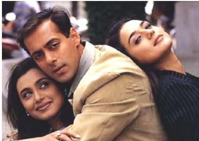
v.l.n.r.: Rani Mukherjee, Salman Khan & Preity Zinta