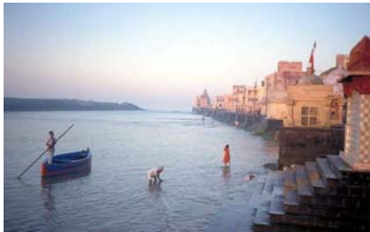
Dwarka, ein alter Hafen an der Küste Gujarats