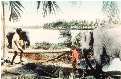
Der junge Amerikaner Terry Bowen (Jay North, r.)